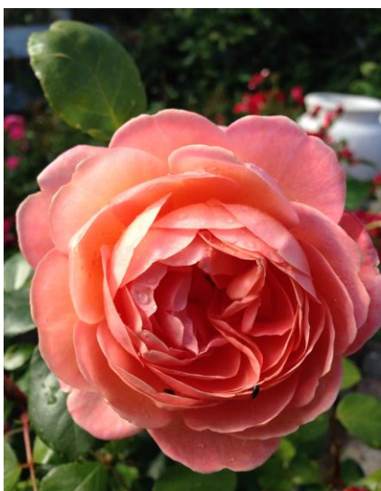
'From far away'