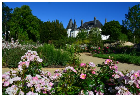
Rozentuin van het kasteel van Munsbach

We bezoeken de rozentuin van het Grand-Château d'Ansembourg. Deze tuin wordt onderhouden door vrijwilligers van het Patrimoine Roses Luxembourg , die als doel heeft het behoud van Luxemburgse rozen. Daarna bezoeken we Le Roseraie du Château de Munsbach, de rozentuin van de Lëtzeburger Rousefrënn. Meer informatie over deze tuin vind je in een artikel van Mireille Steil in onze nieuwsbrief september-oktober 2022. Na de lunch reizen we naar het hotel en de stad Trier. In de namiddag bezoeken we de stad. 's Avonds eten we in het hotel.