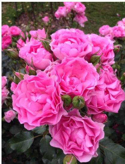
'I am Grateful'