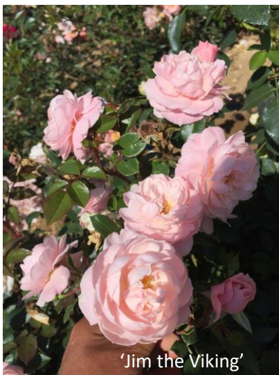
'Jim the Viking'