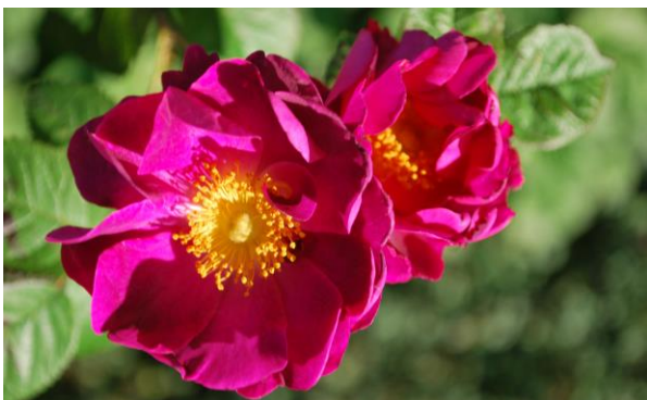
'La Belle Sultane' (Gallica)

De meest bezielende mecenas van de tuinbouw was zonder twijfel Keizerin Josephine Bonaparte. Als echtgenote van Napoleon had ze macht en invloed. Het echtpaar kocht het Chateau de Malmaison, gelegen in een buitenwijk van Parijs, en Josephine nam de taak op zich om het vervallen huis en de tuin uit te bouwen tot een residentie, geschikt voor een keizer.