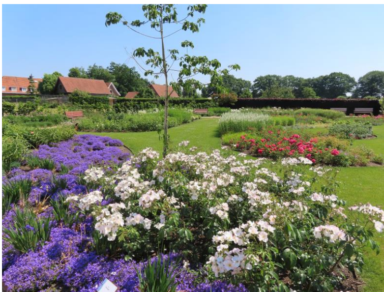
Rozen en vaste planten brengen diversiteit in de rozentuin van Rivierenhof

De voorbije jaren klonk het thema 'duurzaam tuinieren' steeds sterker door. Met onze hobby of onze passie moeten we samenwerken met de natuur. Chemische bestrijdingsmiddelen mogen we niet meer toepassen of zullen we heel gericht en beperkt gebruiken. Dat kan als we kiezen voor rozen die er zonder kunnen. Zo zijn er heel veel. We verwijzen hiervoor naar de resultaten van de verschillende keuringen, in het bijzonder de Excellence Keuringen, de Grand Prix de la Rose en de ADR-keuringen, waarvan de resultaten regelmatig in onze nieuwsbrief verschijnen. Het is zowel voor de bodem- als voor het dierenleven in onze tuin nodig om voor gevarieerde beplanting te kiezen. Een mooi voorbeeld hiervan is de nieuwe rozentuin in het Rivierenhof in Antwerpen. Biodiversiteit bevordert de gezondheid. En, je kan zo nog meer kleur en fleur brengen in jouw tuin. Dit wordt trouwens het thema van volgende jaarvergadering op 13 april. We hopen je daar weer te ontmoeten.