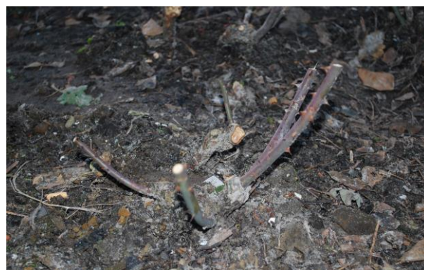
We stimuleren nieuwe takken vanuit de basis door kort te snoeien.

Wat willen we bereiken met het snoeien van struikrozen? We wensen nieuwe groei vanuit de basis te stimuleren, zodat de struik jong en levenskrachtig blijft. Jonge takken hebben altijd de mooiste bloemen en jong hout is minder vatbaar voor ziekten dan ouder hout. We vermijden ziektes als we alle dode hout verwijderen en zorgen dat de twijgen in de zomer niet tegen elkaar schuren. Als we, met dit voor ogen, snoeien, dan zal de struik net voor de zomer een mooie bekervorm hebben en enkele weken later rijk bloeien.