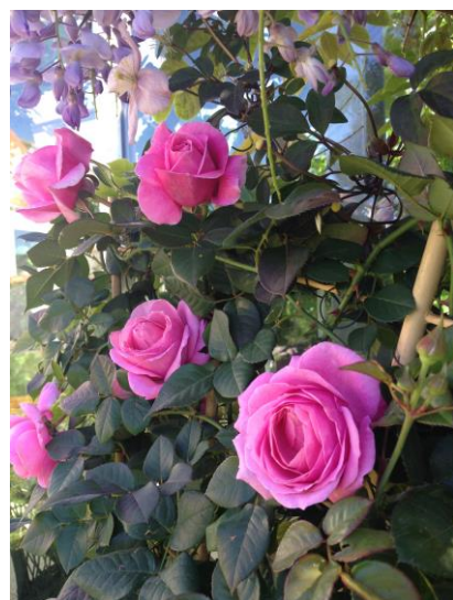
'Our last Summer'

Twintig jaar geleden begon Rosa met het veredelen van tuinrozen, die je vindt onder Plant 'n' Relax op hun website. Ze kruist in de serres met rozen uit haar persoonlijke verzameling. Als het resultaat van een kruising niet goed genoeg is, zoekt ze naar verbetering. De vele prijzen tonen aan dat ze een internationaal gewaardeerde veredelaar is.