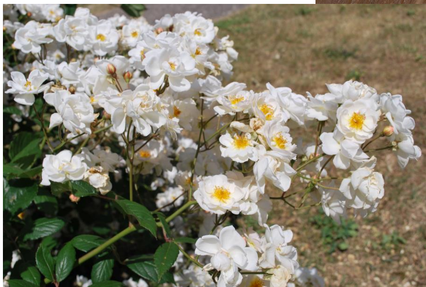
'Trier' in Saint-Clair